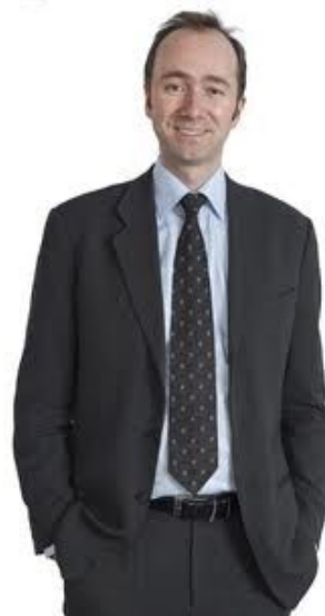
Næringsminister Trond Giske har vore pådrivar for å få til forenklingane i aksjelovgjevinga.

Me vurderar å halde ein informasjonskveld om det å drive eige aksjeselskap - ta gjerne kontakt og meld frå om det er interessant for deg.